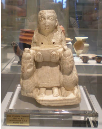
Diosa Astarte de Galera. Granada