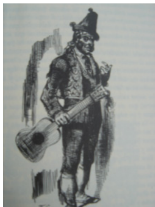
Planeta, según grabado de Lameyer.

Y así de la mano del romanticismo con los sustratos musicales anteriormente anunciados, y otros que se van añadiendo de la influencias musicales de América y con hitos históricos de enorme significado social, como la pragmática de 1783 con la que Carlos III legaliza, como diríamos ahora, a los gitanos para que puedan dedicarse a cualquier actividad u oficio después de tres siglos de persecuciones, por lo que comienzan a establecerse en los arrabales de las principales ciudades andaluzas formando las gitanerías, tan importantes en la génesis del flamenco. Y las revoluciones francesa e industrial que amplían como destinatarios del arte a pequeños burgueses, artesanos, comerciantes y naciente proletariado, y a aquellos aristócratas y cortesanos que se dignaban compartir con el pueblo bajo sus divertimentos; y los viajeros románticos con sus escritos y grabados, y por los caminos de las academias boleras, salones, teatros, seguidillas y tonadillas escénicas, sainetes e intermedios de zarzuela, operas bufas, colmaos, casas de la gula, ventas, bailes de candil, cafés cantantes y tabernas, el flamenco alumbró las últimas décadas del siglo XIX y primeras del XX conformados ya todos los palos y estilos que conocemos en la actualidad. De enorme complejidad formal, lo que obliga al virtuosismo de sus intérpretes, que desde